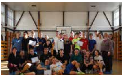
Školský volejbalový turnaj