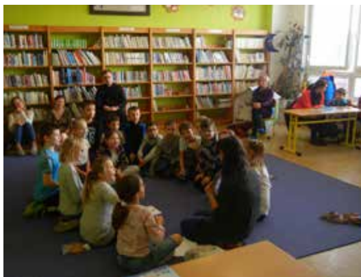
Deň otvorených dverí