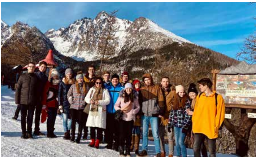
Vychádzka na Hrebienok počas duchovných cvičení tretiakov v Dolnom Smokovci