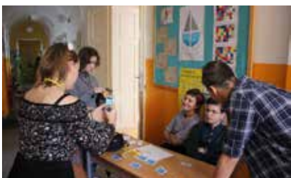
Deň otvorených dverí

Na našej škole funguje už niekoľko rokov nezisková organizácia Mišík, n.o. , ktorej činnosť je zameraná na skvalitnenie života školy a pre úžitok jej študentov. Chceli by sme vás aj touto cestou poprosiť o 2 % z vašich daní, aby sa nám ešte lepšie darilo uskutočňovať výchovno-vzdelávací proces vašich detí. Ďakujeme. •